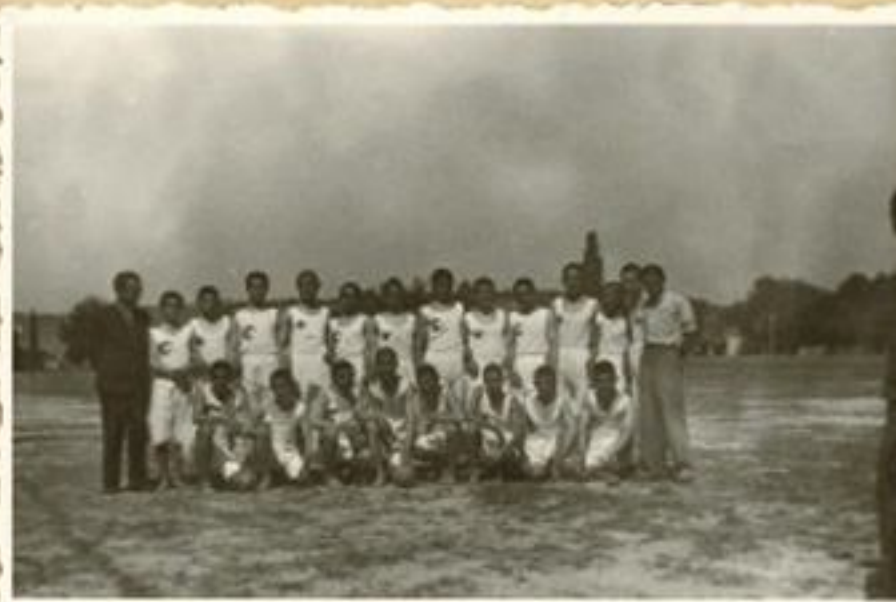
Kızıllı Köy Enstitüsü futbol ve voleybol takımı (1942)