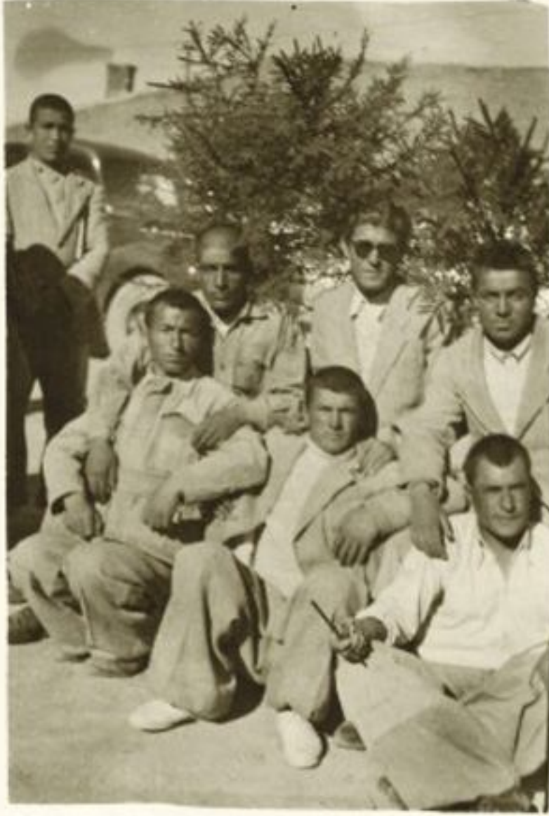
Erzurum - Pulur Köy Enstitüsünde öğrencilerle (1947).