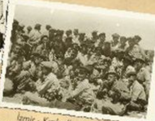
İzmir - Kızıllı Köy Enstitüsü Kozanoğlu'na kamp, yemek malası (1942).