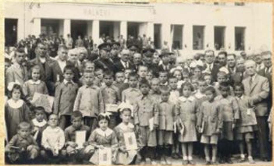
İlkokul birincileri ödül töreni hatırası. Ödülüm şık siyah bir kutuda pergel takımı idi. Sağda çocukların hemen arkasında 5. önemli kişinin yanındaki kocaman kurdele benim. Boyum uzun diye en arkadayım.