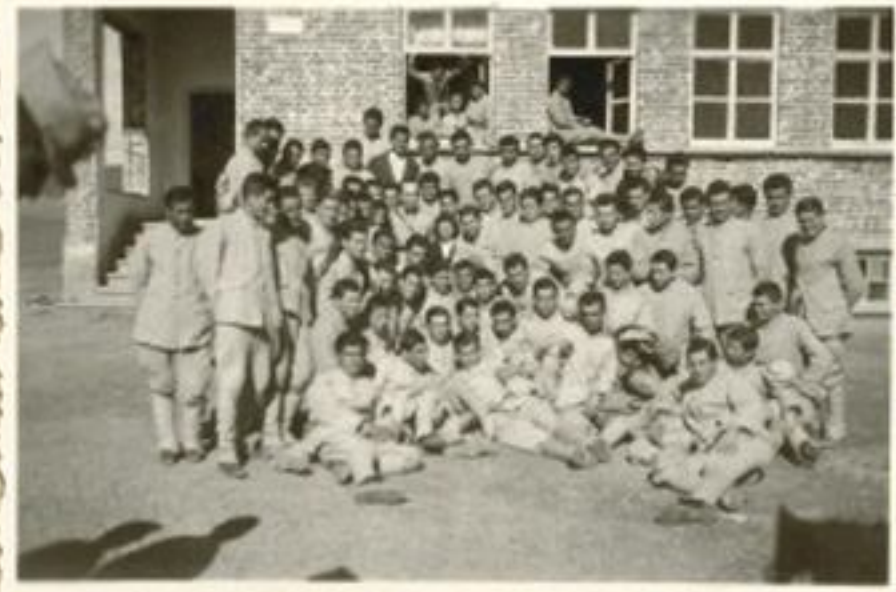
Yüksek Köy Enstitüsünde askeri kampta. Karabiberler Çiftliği (1945).

Köy Enstitüsü'nde bir gün nasıl geçirdi diyoruz. Hemen anlatmaya başlıyor. "Kolay değil otuz beş yıl bir mesleğe adanmış, kimi zaman sürgünlerle karşılaşmış bir ömür var karşımızda. Saat: 07: 30 da spor yapılırdı. Mandolin, akordeon, davul eşliğinde yarım saat halk oyunları oynardık. 08: 00 - 12.00 arasında derslerimiz vardı. 12.00- 13.00 yemek arası.13.30 - 17.00'ye kadar yine kültür dersleri verilirdi." Meslek derslerinde yaparak, yaşayarak bir öğrenme söz konusuymuş. Yapıcı bölümünü seçen öğrenciler okulun inşası ile ilgilenirken, marangoz bölümü ise kapı ve pencere aksamı ile alakadar oluyormuş. Yapıcılık ile uğraşan sınıf