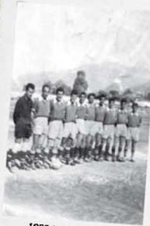
1956, Yeşilspor:2 - Altay:1