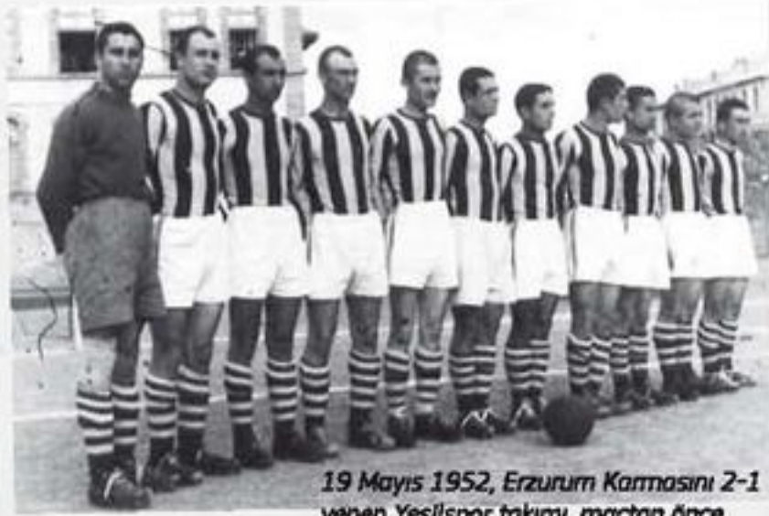
19 Mayıs 1952, Erzurum Karmasını 2-1 yenen Yeşilspor takımı, maçtan önce