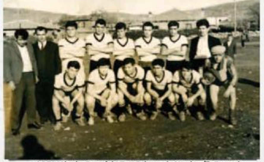
1961 Yılında Çayırdaki Top Sahasında Yapılan İlk Formatlı Tavas Gençlik Futbol Takımı

Tavas'ta futbola genel ilgi, 1960-61'lerde Kültürspor-Esnafspor rekabetiyle başladı. Tavas'tan kalkıp Denizli'de okuyan gençlerden oluşan Kültürspor ile Tavas'ta esnaflık yapan ve "çırak" olan bir çok arkadaştan oluşan Esnafspor'un zaman zaman toprak ve taşlı (şimdiki Tavas Stadyumunun olduğu) yerde yapılan maçlardan sonra, yepyeni bir amatör takım çıktı: Tavas Gençlikspor.