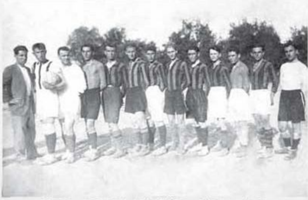
22 Mart 1928, Denizli Hilâl Gençlik Futbol Takımı