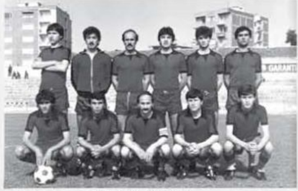
1979, Sarayköyspor takımı