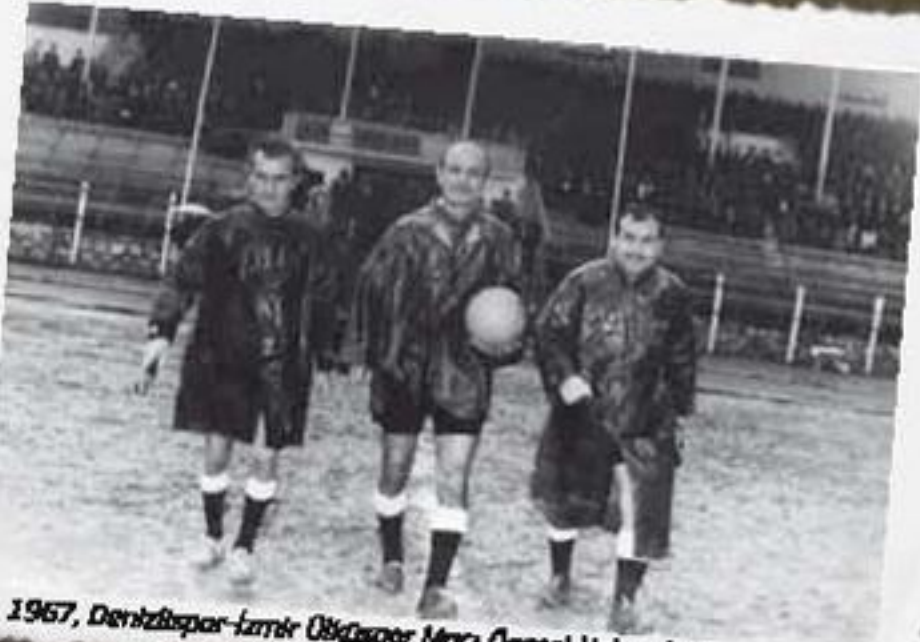
1967, Denizlispor-İzmir Üsküdarspor Maçı Öncesi Hakemler