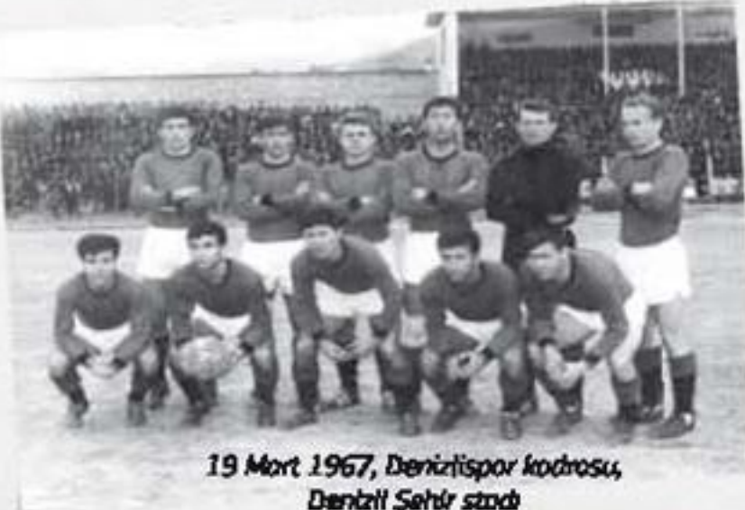
19 Mart 1967, Denizlispor kadrosu, Denizli Şehir stadi