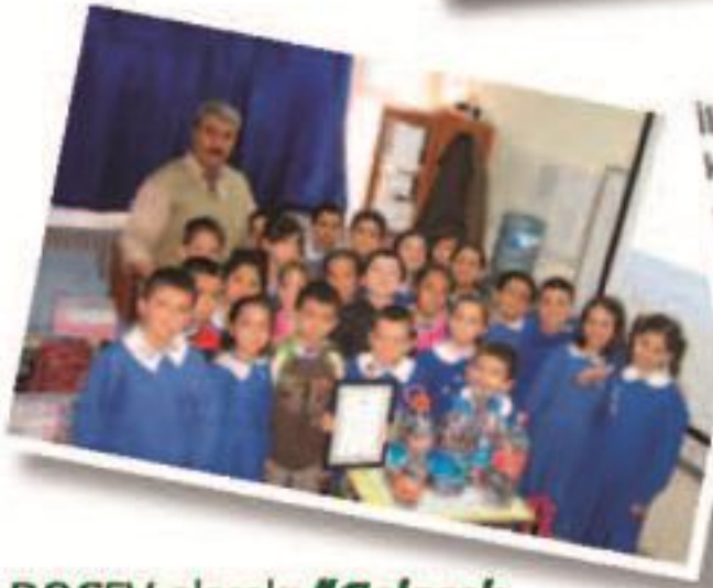
İlköğretim okulu öğrencilerinden örnek kampanya

DOÇEV, 10 yıl süren geri dönüşüm çalışmalarından 21 ton karşılığı yaklaşık 1 milyon 250 bin adet kullanılan pili çevresel zararlarından arındırarak 5 milyon m 3 toprağı kirlenmekten kurtardı.