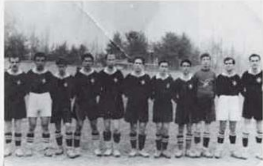
1940'ü Yıllar Buldan Gençlik Spor Takımı