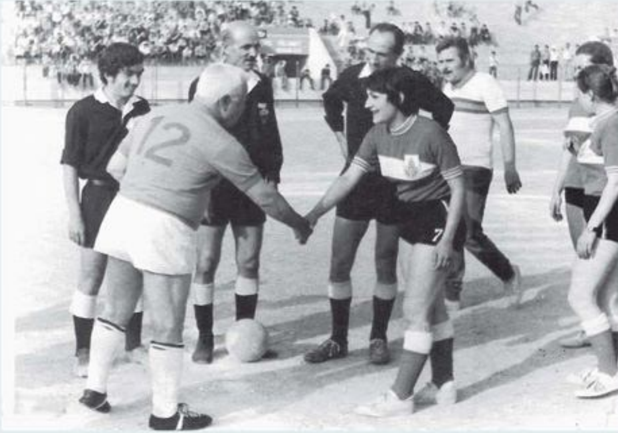
1973, Denizli Emekliler karması ile İstanbul Kız Futbol Takımı karşılaşması. Netice: Emekliler 4, Kızlar 2

içinde futbol Denizli'de her geçen gün yayılıyordu. Nitekim, bu defa Gençlerbirliği takımının kuruluşunu hemen takiben, Sarayköy ilçesinde de Sarayköy Gençlik Kulübü kuruldu.