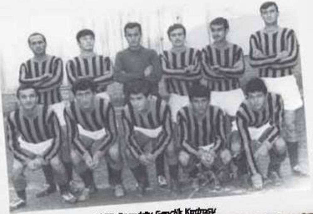
1968, Sarayköy Gençlik Kurumu

O dönemlerde Cumartesi günleri maç için Sarayköy'den Denizli'ye futbolcular gideceği zaman dolmuşun içinde hazırlandıklarını, mahalledeki esnafında dükkanları kapatıp maça gittiğini, otobüsün içi çok kalabalık olduğu için Kumkısıık yokuşuna gelindiği zaman arabanın çekmediği, yolcuların arabadan inip otobüsü ittirdiğini söylüyor.