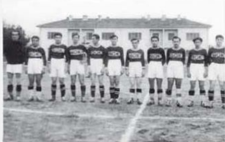
1950'ü Yıllar Buldan Gençlik Spor Takımı