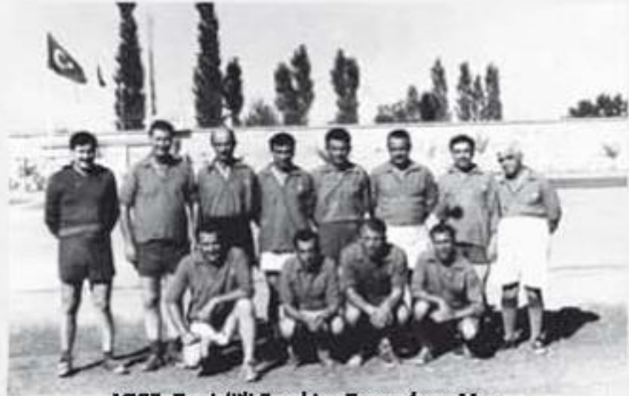
1962, Denizli'de Erkekler Sporcuları Maçı Yer: Denizli Şehir Stadyumu