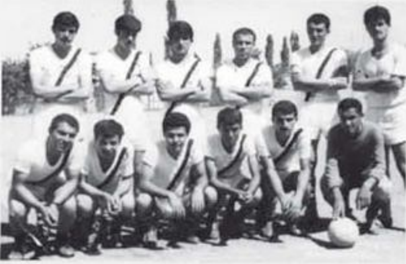
1964'te, Denizli Stadyumunda Çivil Gençlik ile oynanan maç öncesi