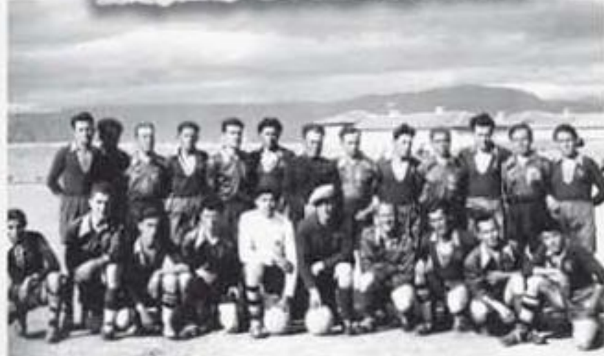
1957, Soraykaly Spor- Denizli Takımı