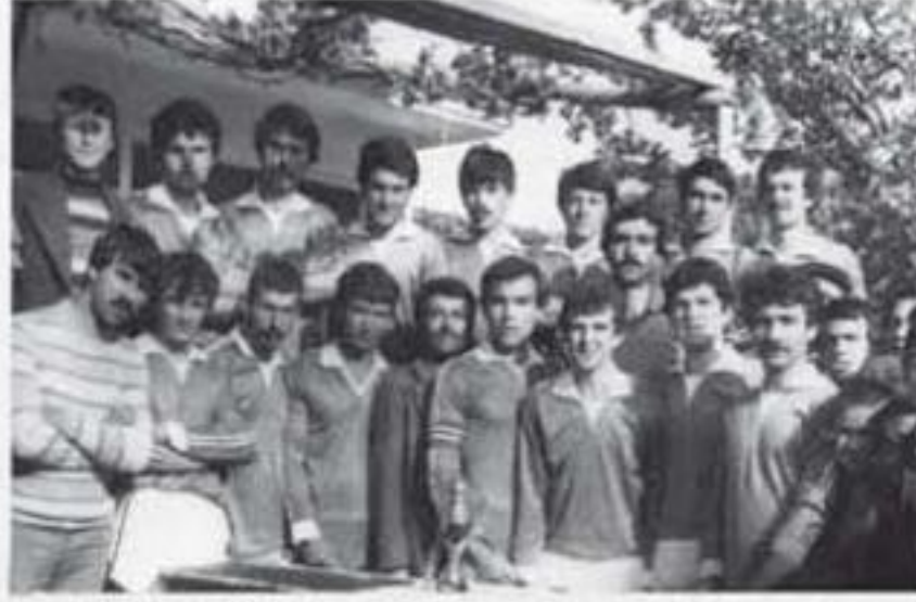
1981 Yılında Kaymakamlık Kupasını Kazanan Kale Gençlik Spor

Ağırlıklıla futbol üzerine koyulaşan sohbet ortamı, bu arada yapılan "çift kale" maçlarla kardeşlik havası iyice perçinleşir. İşte bu birlik beraberlik, Kale'de yeni bir takımın doğmasına yol açar.