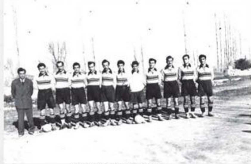
1952, Yeşil Spor Kadrosu