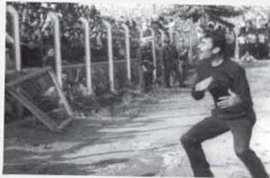
Arıgıoğlu ile Taraftarların Çatışması