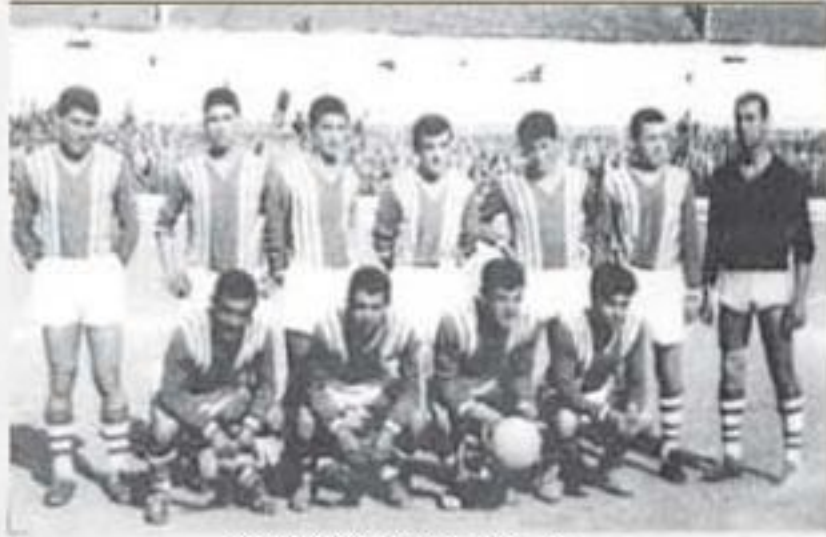
1960, Çiğdemspor Takımı