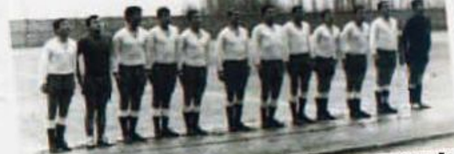
1965, Takvîyeli Denizli Karagücü, Türkiye Amatör Şampiyonası Matç Öncesi