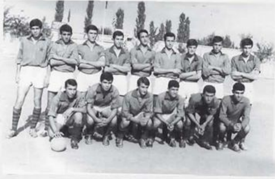
1964, Merkez Gençlik Takımı