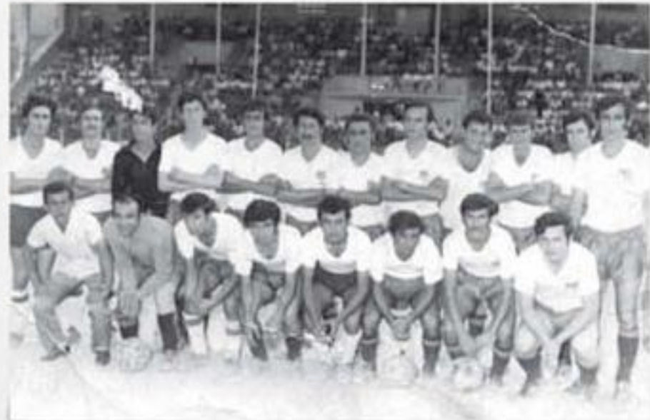
1969, Merkez Gençlik - Karagücü Maç Öncesi