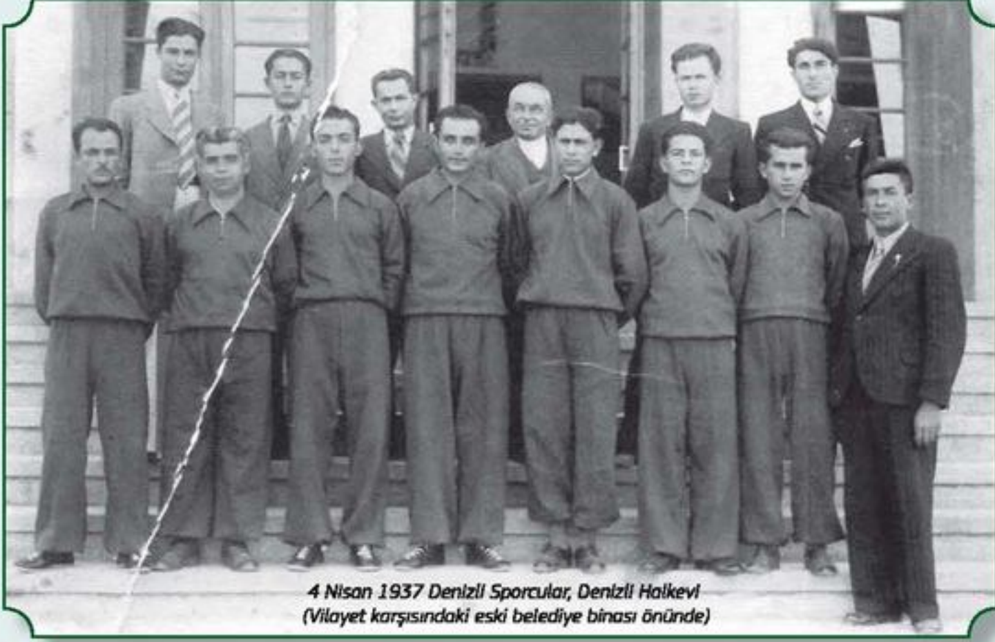
4 Nisan 1937 Denizli Sporcular, Denizli Halkevi (Vilayet karşısındaki eski belediye binası önünde)