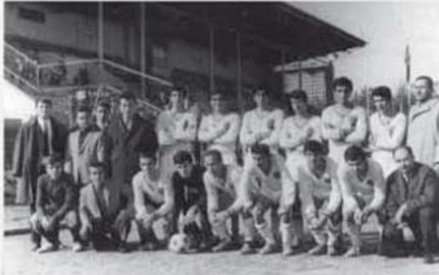
1969, Merkez Gençlik- Buldan Gençlik maçtan önce