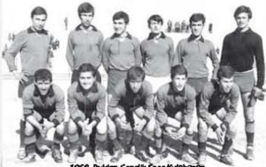
1968, Buldan Gençlik Spor Kulübünün kadrosu