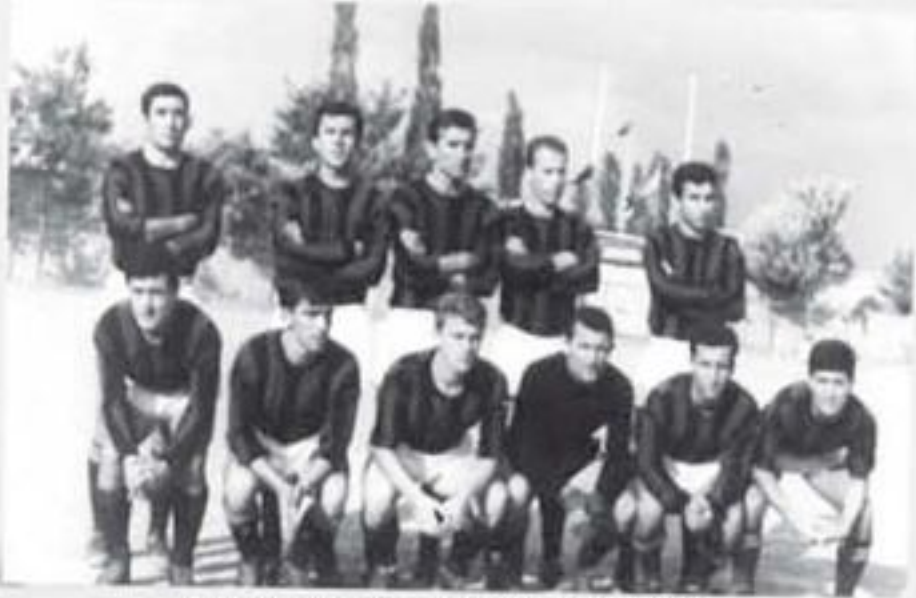
1966, Denizlispor - Nazilli Spor Maç Öncesi