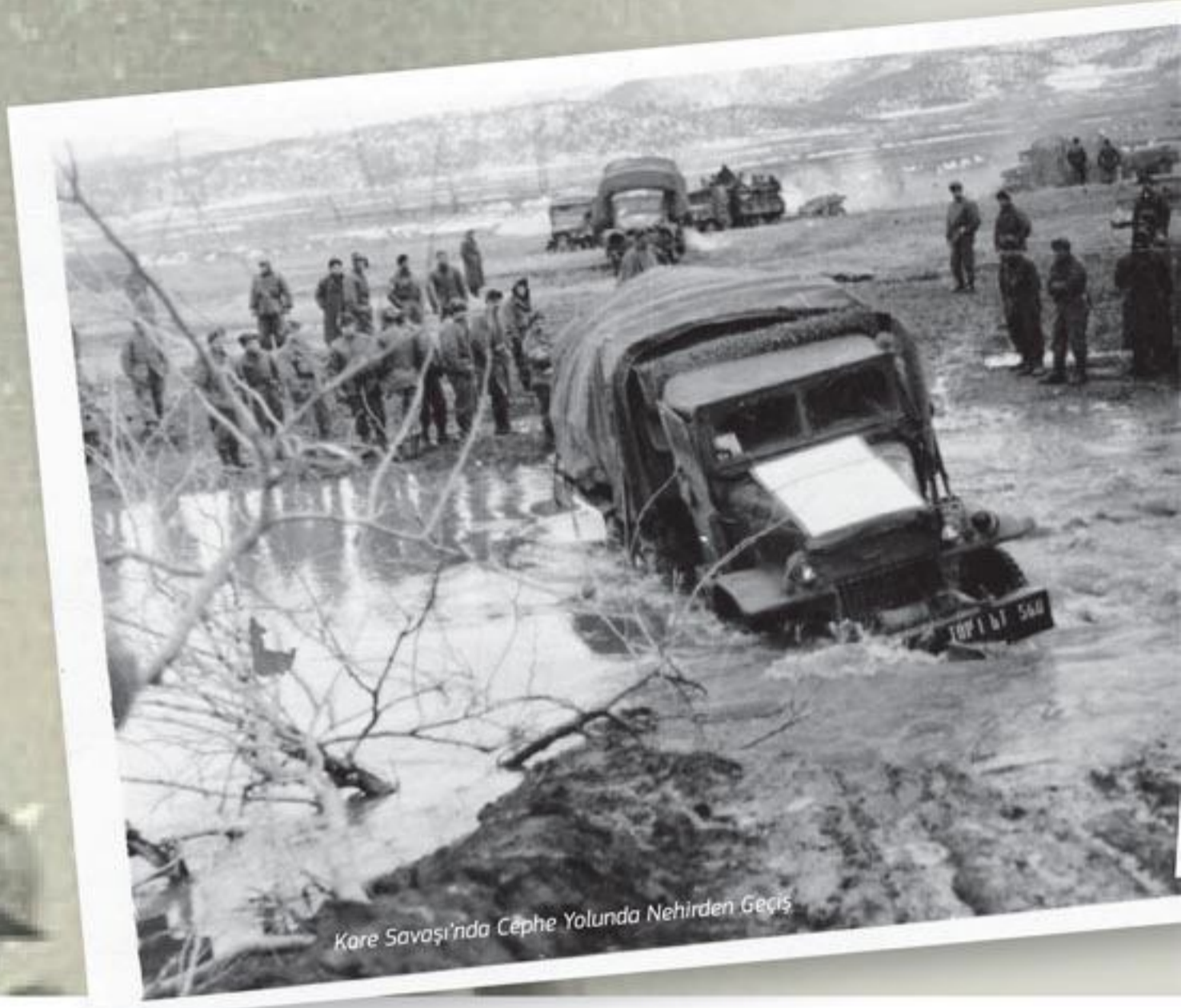
Kare Savaşı'nda Cephe Yolunda Nehirden Geçiş

fakir olduğu için askerî liseye giderek onları benim yükümden kurtarmak istedim. Bursa Askeri Lisesine (Işıklar Askeri Lisesi) müracaat ettim, 15 gün bu okulun kursuna gittim. Okul için aldığım raporda ciğerlerimde kireçlenmiş galbiyon (verem mikrobu) olması sebebiyle okula kabul edilmedim. Bu kez verem olduğumu düşünerek endişelendim, ancak bu endişeyi kısa sürede üzerimden attım ve eğitimime devam etmeye karar verdim ve yine Denizli Lisesine kayıt yaptırdım. Ancak liseye devam ederken kendi kendime: "Kadir sen fakir bir ailenin çocuğusun, para kazanman gerekli!" dedim ve lise eğitimimi yarıda bırakarak Milli Eğitim Müdürüne çıktım, "öğretmen vekili olacağım ben" dedim. O zamanlar ortaokul mezunu olmak çok önemli. Ortaokulu bitiren dilerse öğretmenlik yapabiliyor. Bu isteğim kabul oldu ve beni Güney'e gönderdiler. Bekâr olduğum için ev bulamadım ve geceleri okulda bir masanın üzerinde uyumak zorunda kaldım. İlkokul dördüncü sınıfların öğretmenini olarak burada bir ay görev yaptıktan sonra hastalandım, Doktor Behçet Uz'un kardeşi Nuri Ağabey de Güney'de idi. Ona, "çok hastayım ben burada yapamayacağım" dedim. Bir taksi ile Buldan'a, oradan otobüsle