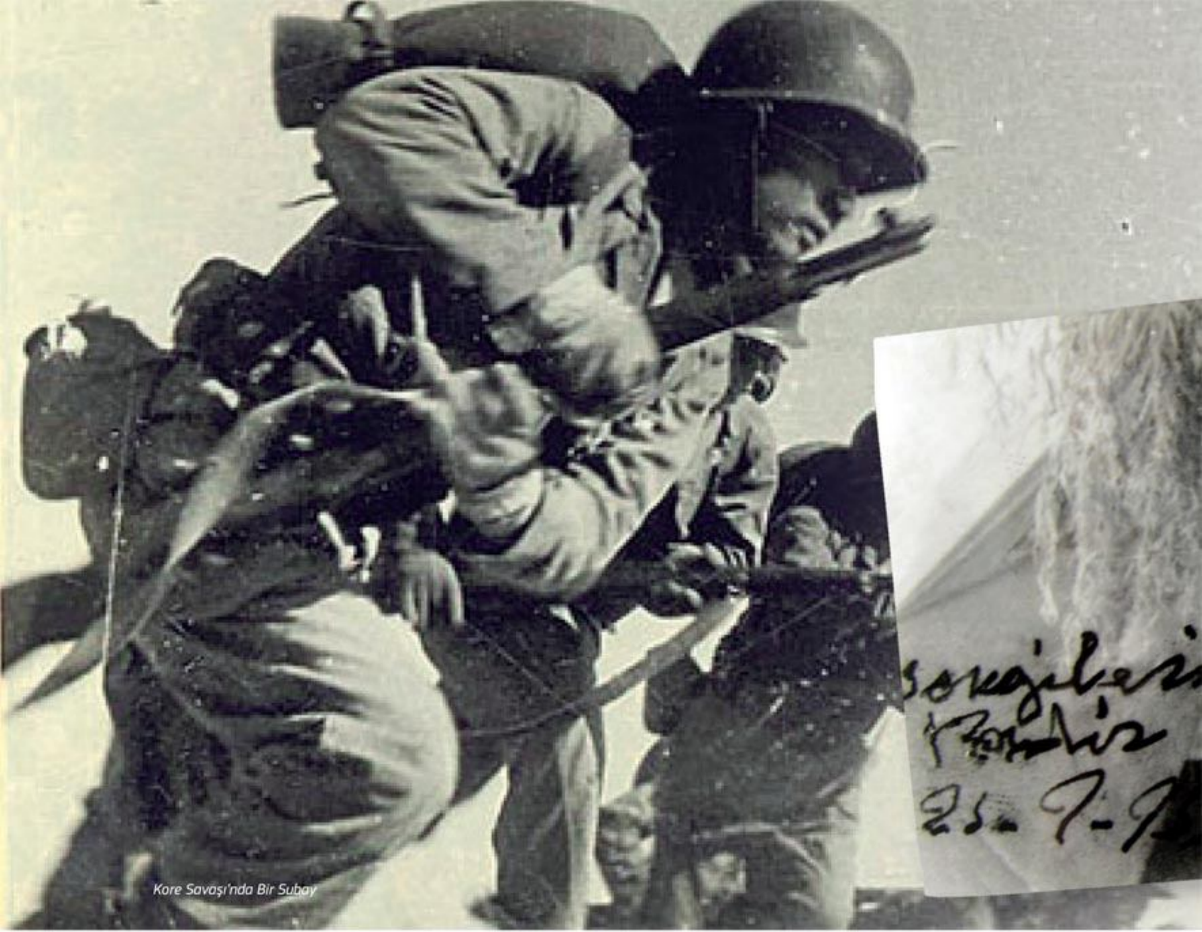
Kore Savaşı'nda Bir Subay

bıraktım, bir daha da pilot koltuğuna oturmam. Artık karacı olmaya karar vermiştim. Eğitimin ardından ülkeme dönmek için yola çıkmak üzere Washington'a gittim. Türkiye'ye dönecek vapuru beklerken, üç ay burada gezme ve Amerikan kültürünü tanıma fırsatı buldum. Washington'da kaldığım sürede New York'u da gezdim. Ülkeme olan özlemim artmıştı, bu özlemi 9. caddede bulunan, Rumlara ait olan, Türk yemekleri yiyebildiğim lokanta ile gidermeye çalıştım. Nihayet üç ayın sonunda gemi ile ülkeme doğru yola çıktım. Gemide bulunduğum esnada asteğmenlikten teğmenliğe terfi ettiğimin haberini aldım. Napoli'ye kadar gemi ile geldikten sonra uçakla Kahire'ye geçtim. Kahire'den Türkiye'ye döndüm ve Denizli'ye geldim.