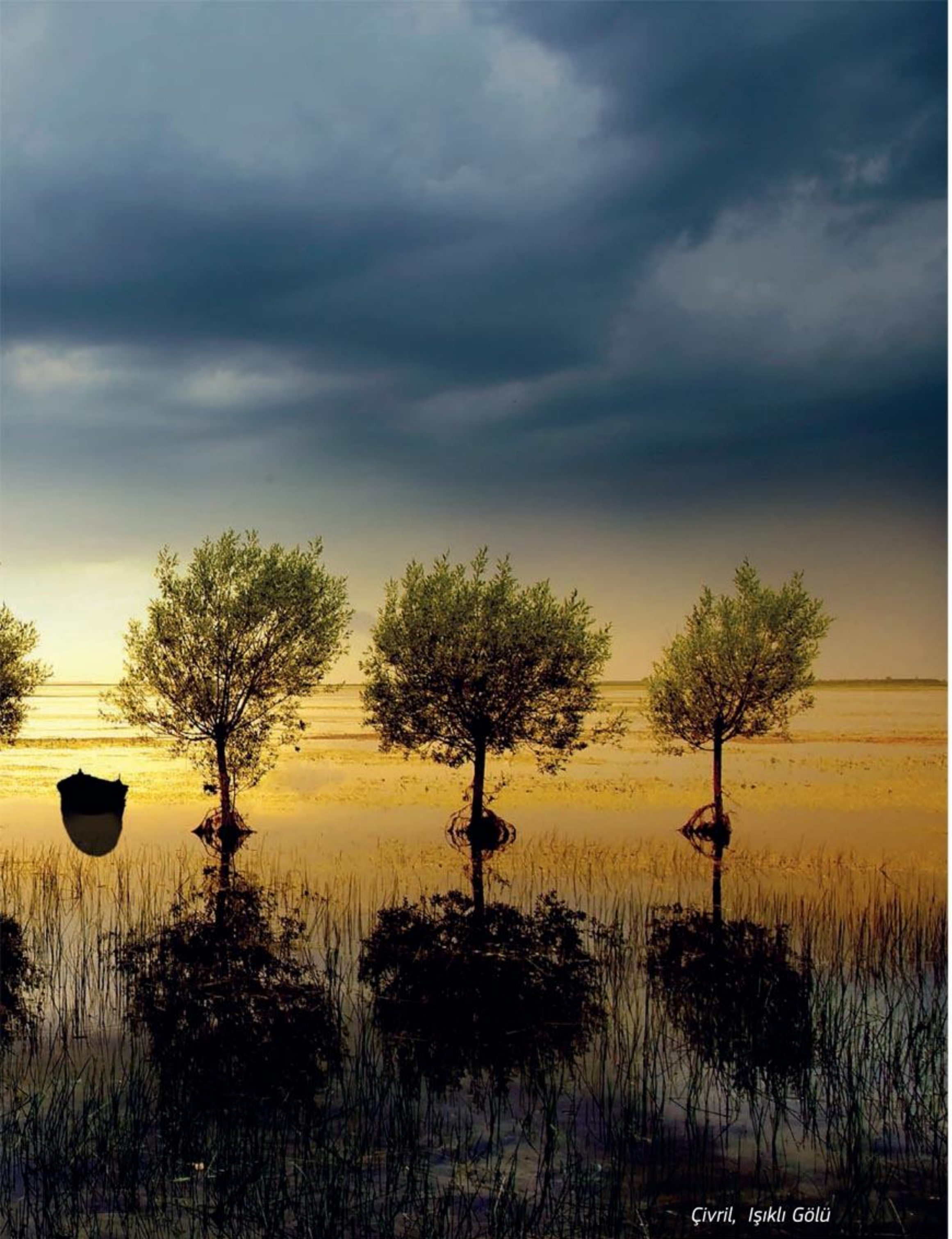
Çivril, Işıklı Gölü