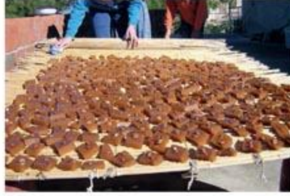
"Kurutulma aşamasında köhtü".

Ayrıca, pekmezden yöre halkının çok sevdiği ve köhtü adını verdikleri yiyecek de yapılmaktadır. Günümüzde köhtü çok yaygın olmamakla birlikte eski yılların vazgeçilmez yiyeceklerindedir. Köhtü yapılan pekmezin yapımı normal pekmezden daha fark-