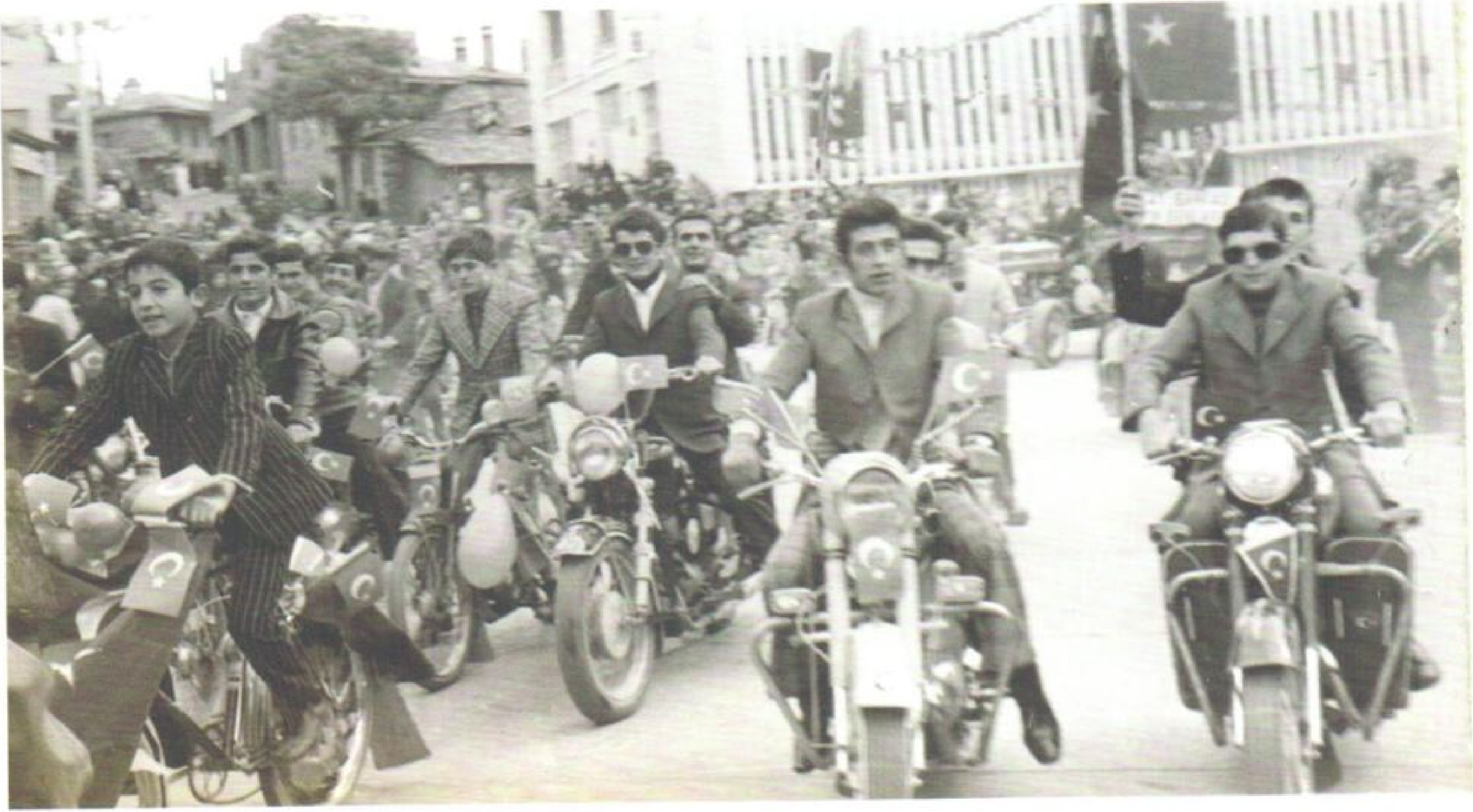
Tavas'ta Cumhuriyet Bayramı (1971)