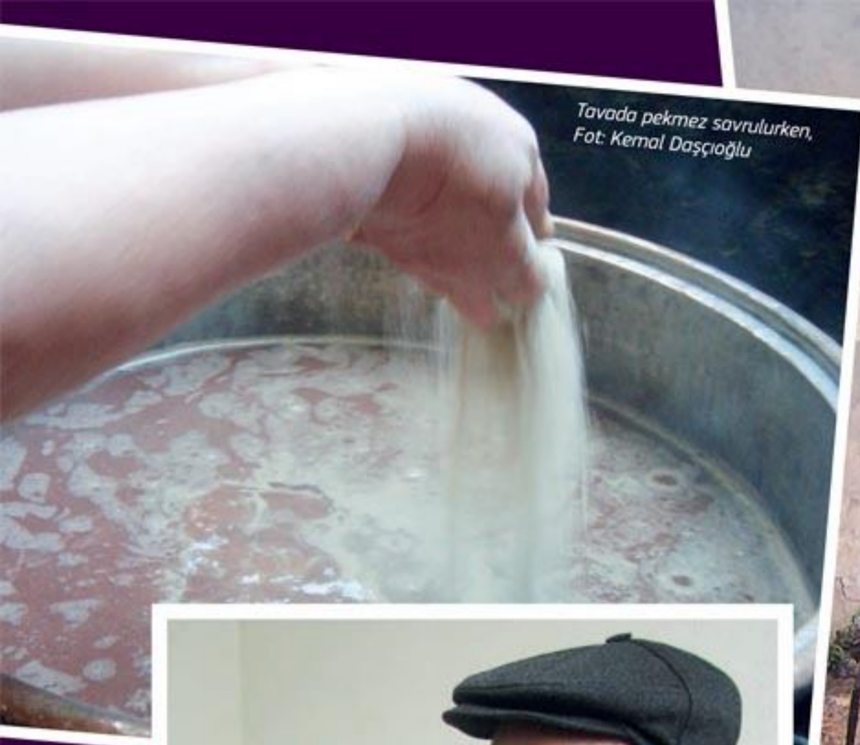
Tavada pekmez savrulurken, Fot: Kemal Daşçıođlu