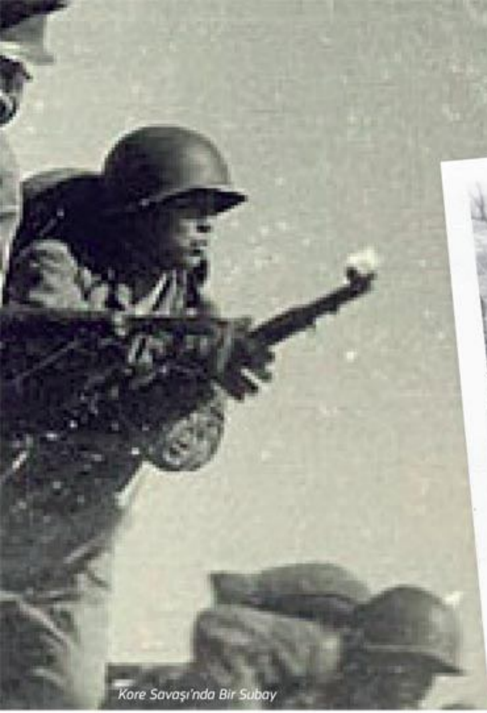
Kore Savaşı'nda Bir Subay