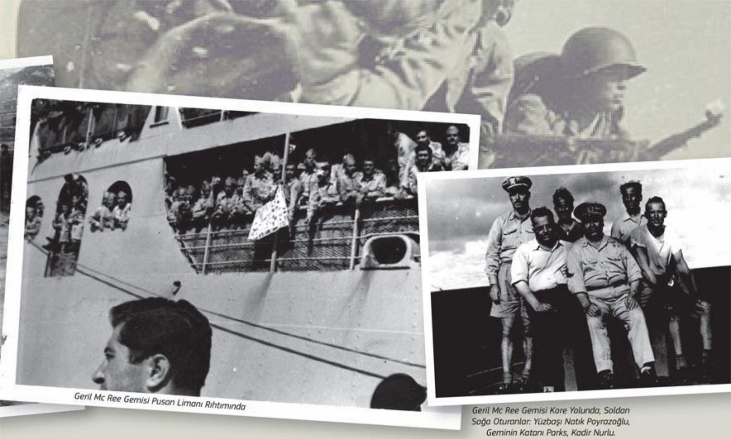
Geril Mc Ree Gemisi Pusan Limanı Rıhtımında