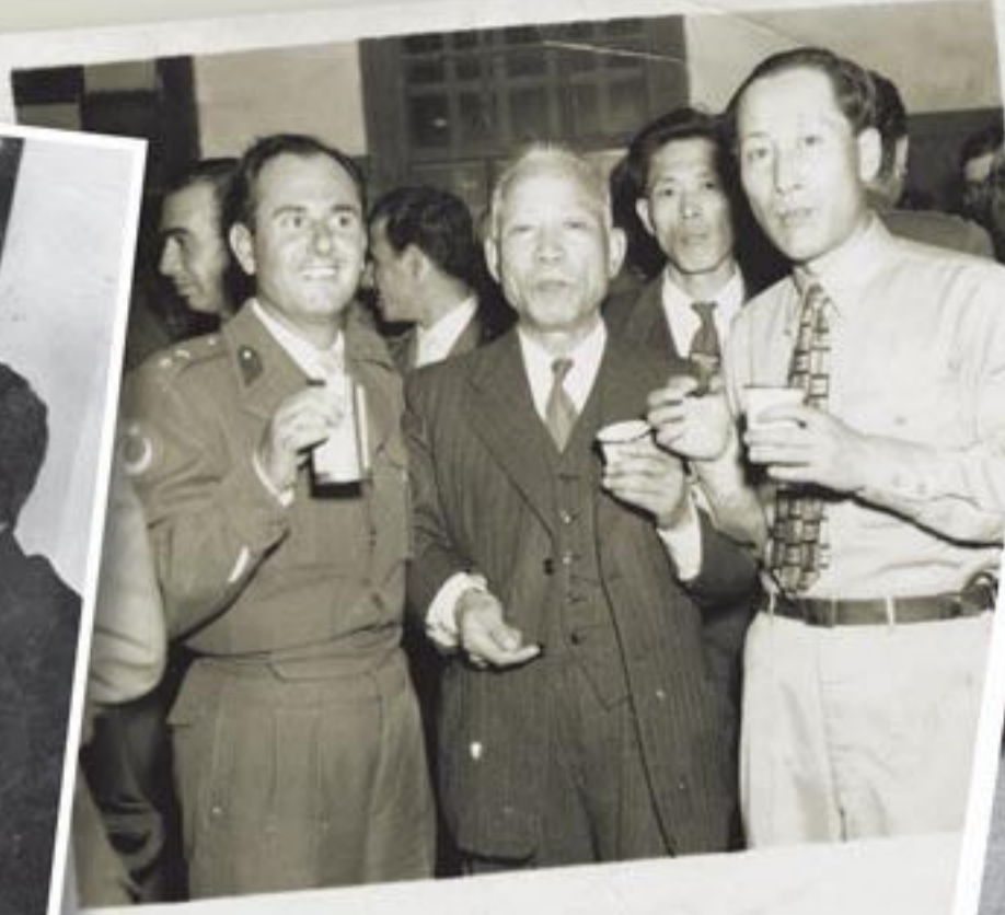
29 Kasım 1950 Bayram Kutlaması-Taegu