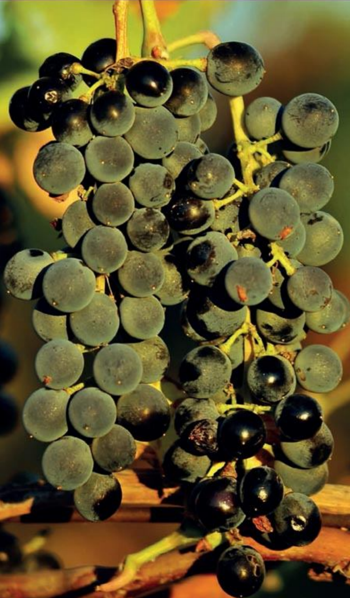
Çalkarası üzüm

Pekmez yapımı çok zahmetli ve zor bir iştir. Bu yüzden elde yapılan pekmezden satarak ticari kazanç elde etmek de pek mümkün değildir. Özellikle, çalkarası üzümünden lâyıkıyla pekmez yapmak zahmetli ve masraflı bir iştir. Çünkü 31 derece kıvamında yapılan pekmez, kaynatma esnasında çok fire vermektedir. Örneğin 100 litre çalkarası pekmez şirasından yaklaşık olarak 35-40 litre civarında pekmez çıkmaktadır. Geri kalanı su olarak buharlaşmaktadır.