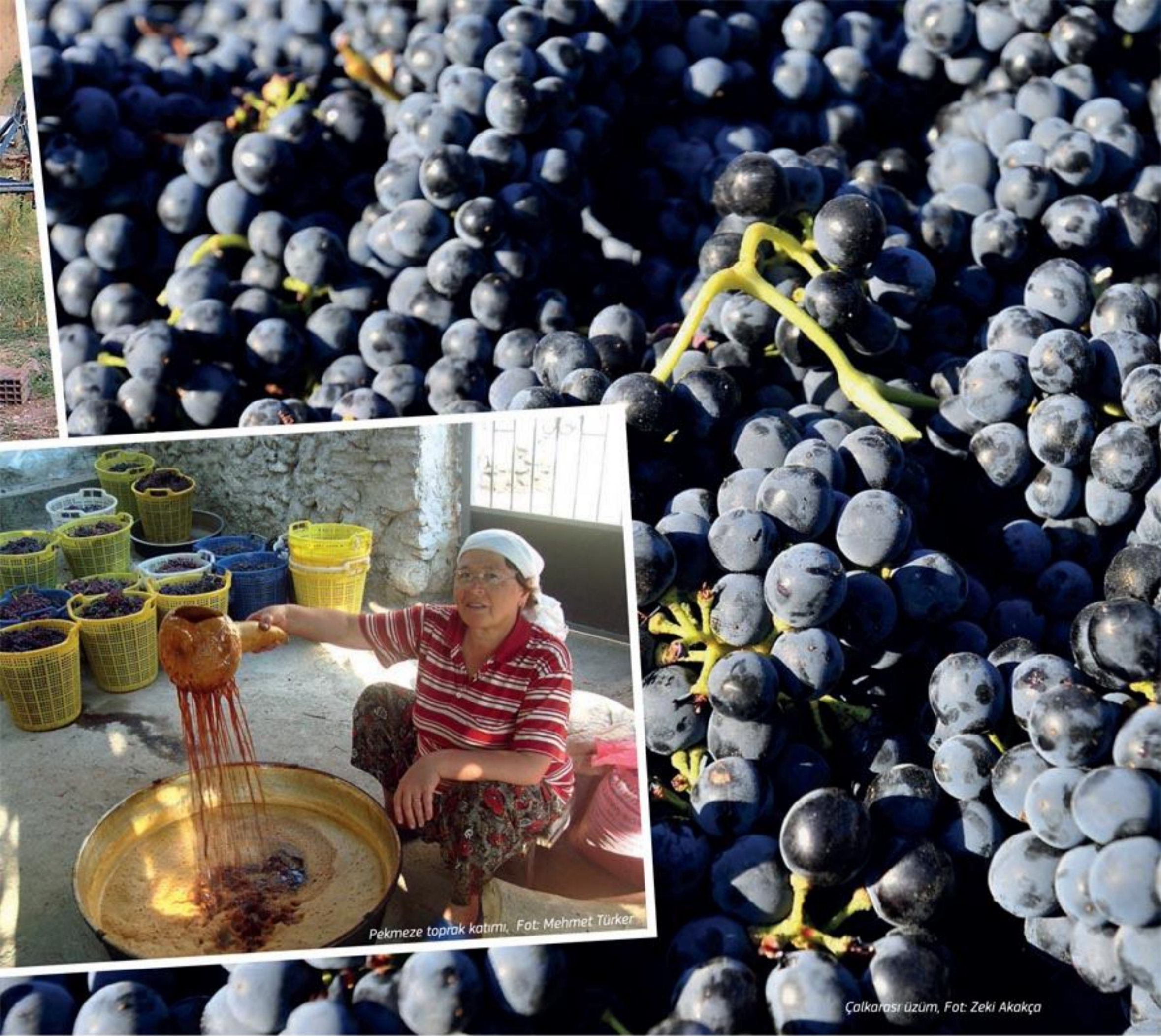
Pekmeze toprak katımı.